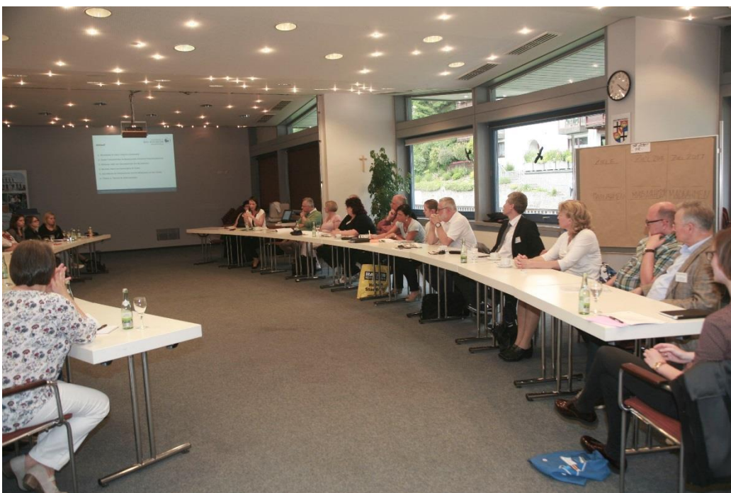
Bild: Zweites Netzwerktreffen, Juni 2016, Bad Bocklet