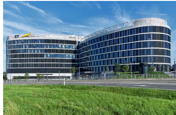
ZMI in Stuttgart

Für ZMI ist die Niederlassung Stuttgart der sechste Standort innerhalb der DACH-Region. Weitere Niederlassungen sind für die nähere Zukunft geplant.