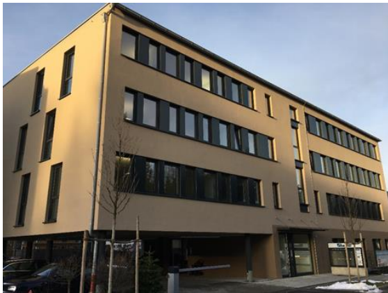
ZMI in München