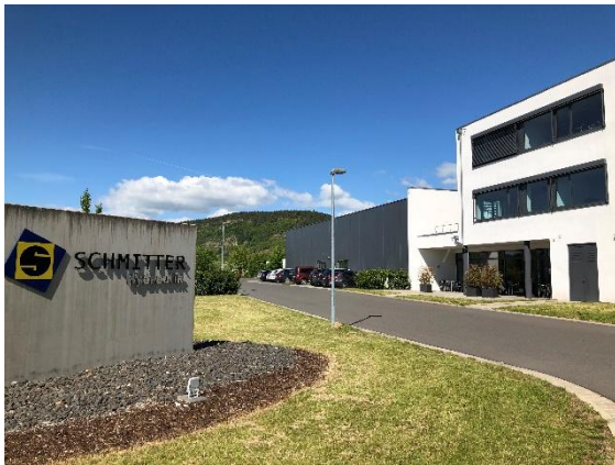
Einfahrt zur Schmitter Hydraulik

Das neue Hammelburger Zuhause des Unternehmens wurde am 27. Juli 2013 eingeweiht und in Betrieb genommen.