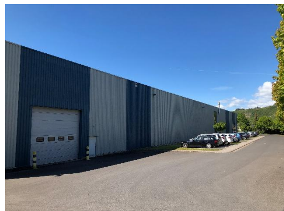
Die bestehende Lagerhalle

Läuft alles nach Plan, beginnen noch in diesem Herbst die Bautätigkeiten. Die neue Halle soll dann bis Jahresende 2019 weitgehend eingerichtet sein und in die Abläufe des Unternehmens eingebunden werden.